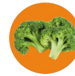
Alpha lipoic acid Ácido alfa lipoico