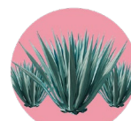
Agave inulin Inulina de agave