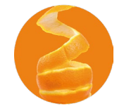
Bitter orange peel Cáscara de naranja agria