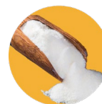
Hydrolyzed collagen Colágeno hidrolizado