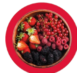
Berries Frutos rojos