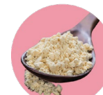
Soy protein Proteína de soya