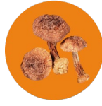
Royal sun mushroom Hongo royal sun