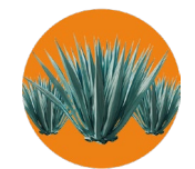
Agave Inulin Inulina de agave