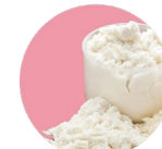
Whey protein Proteína de suero de leche