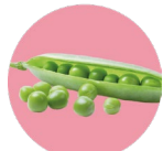
Pea protein Proteína de chícharo