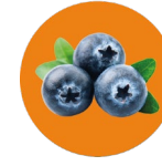
Blueberry and minerals Blueberry y minerales