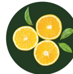
Vitamin C Vitamina C