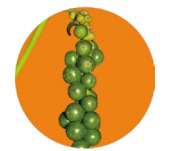
Green coffee seed Semilla de café verde