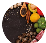
Vitamins and minerals Vitaminas y minerales