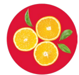
Vitamin C Vitamina C