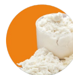
Whey protein Proteína de suero de leche